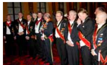
De tolv som var med vid årets Barbara...