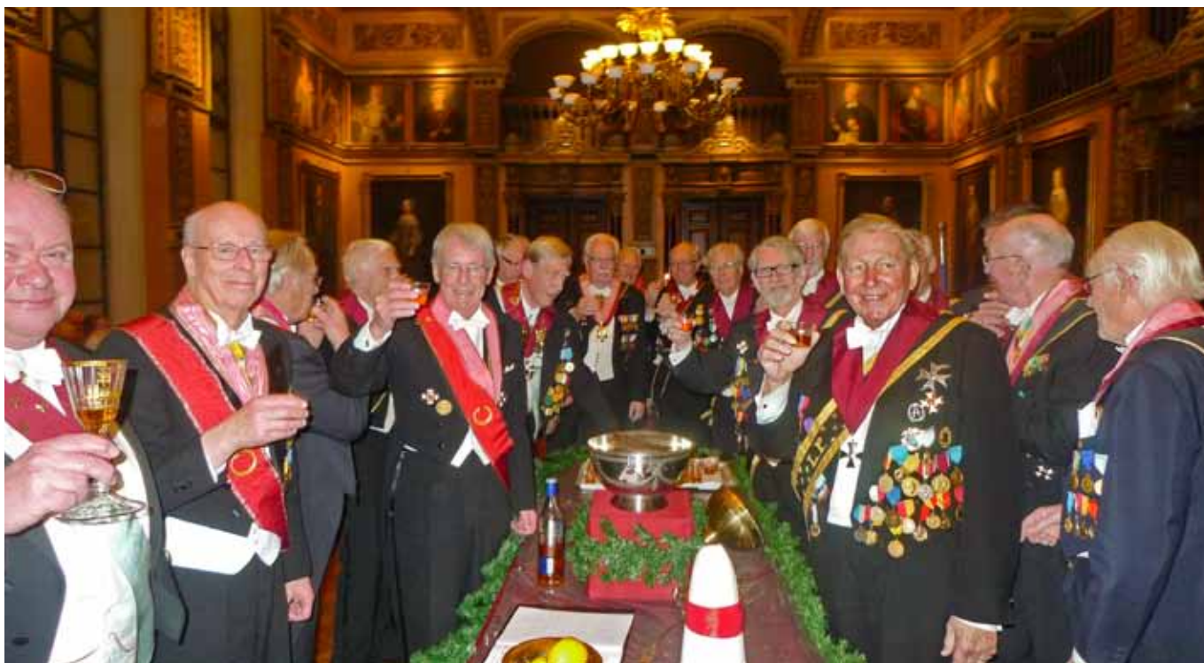
Central företeelse i Barbara-festen, den traditionella avsmakningen av Barbaras fluidum, Punschen. Här är de högsta graderna som smakar.