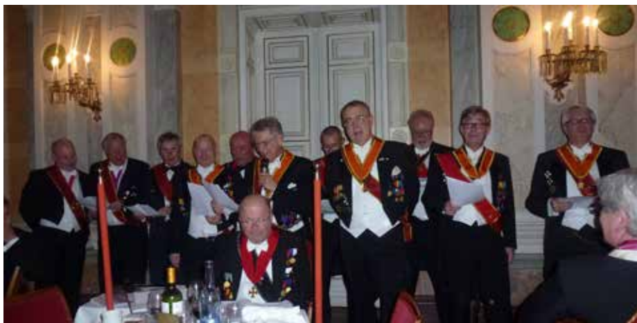
Vi har många kreativa Bröder. Här är General-Ceremonimästaren hyllning till de Styrande i form av en modern rapp. Han fick han hjälp av ett 10-tal Ämbetsmän i denna hyllning.