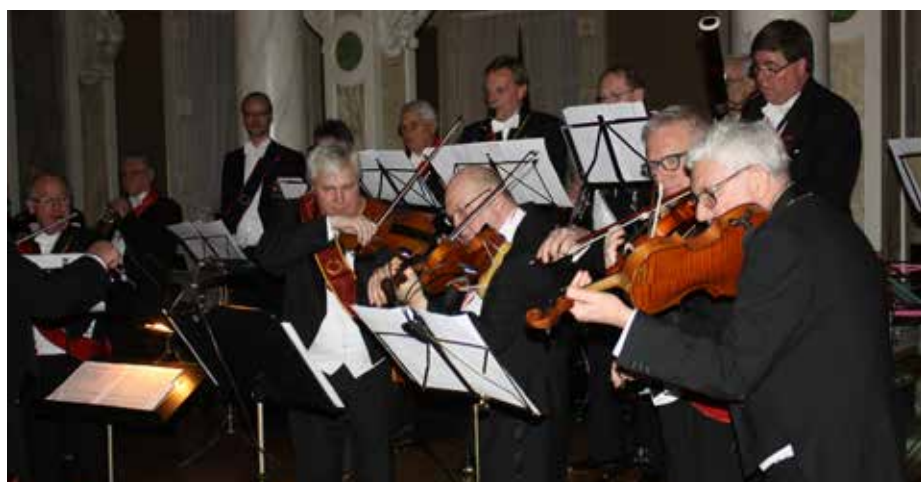
Musikens violinister tar i när de tillsammans med kvällens orkester framför ett verk av Verdi.