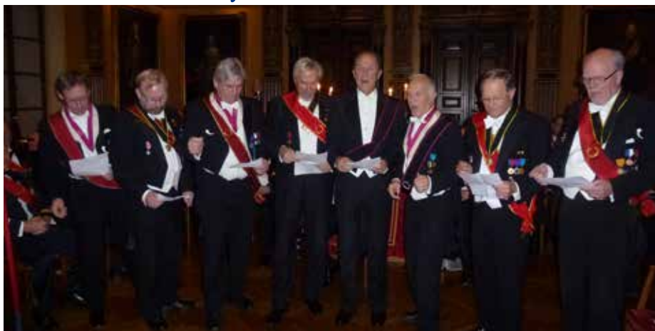
Och här en annan kreativ skara Bröder, som framförde en bejublad Barbara-version av den gamla Beach Boy-hiten "Barbara Ann" - med både stäm- och falsettsång...