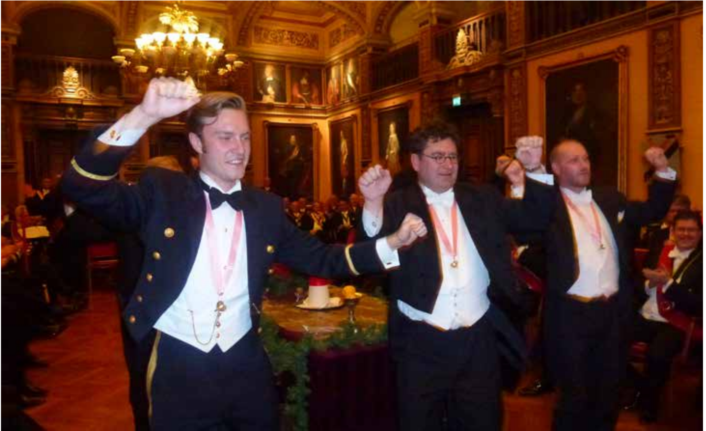
Tre av kvällens recipiender prövar att följa den gamle balettmästarens instruktioner i Can-Can.