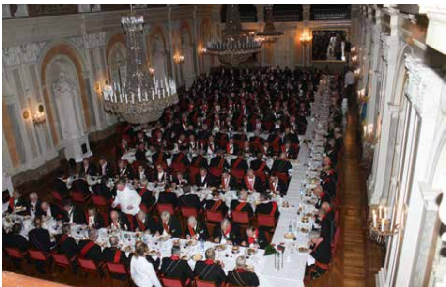
Och så till sist den pamfiga översikt bilden över Knutssalen i Malmö Rådhus med samtliga 232 deltagare vid årets Barbara med på samma bild.