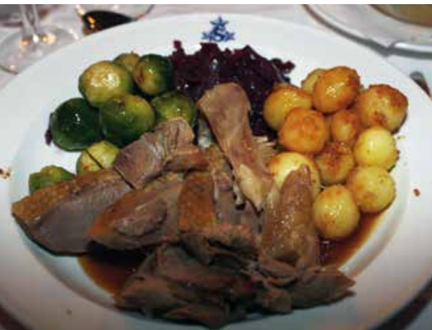
Kvällens festmåltid, en fantastisk gååååååå med tillbehör.