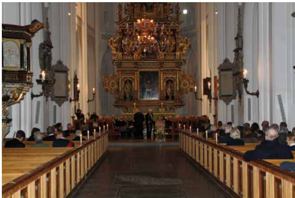
Parentationshögtiden i S:t Petris nyrenoverade kyrka blev mycket stämmingsfull och värdig.

Årets traditionsenliga parentation genomfördes i S:t Petris pietetsfullt renoverade kyrka på Fars dag, söndagen den 11 november.