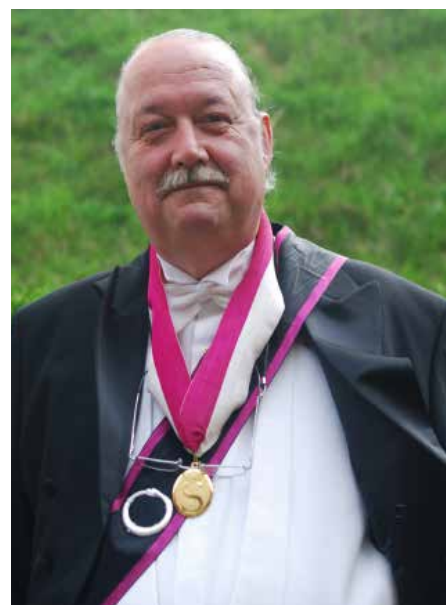
Ordenstrubaduren, som talade sitt tack i stället för att framföra det med sång

Det har väl både gått i dur och moll Jag sänker nu de ynkliga små bladen Bortglömmer detta dikitade elände och bringer ut en skål för Par Bricole samt tackar ödmjukast för sjunde graden.”