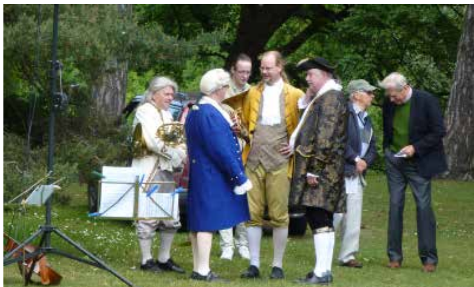
Bröder både med 1700-talskläder, och utan...