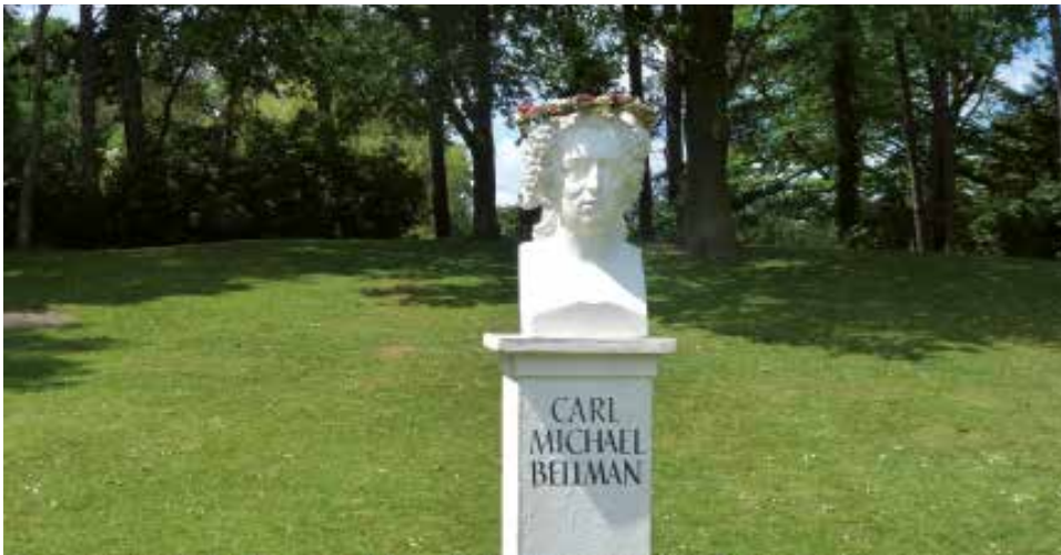
Fin bild på vår blomsterbekransade Bellman-byst i härligt försommarväder.